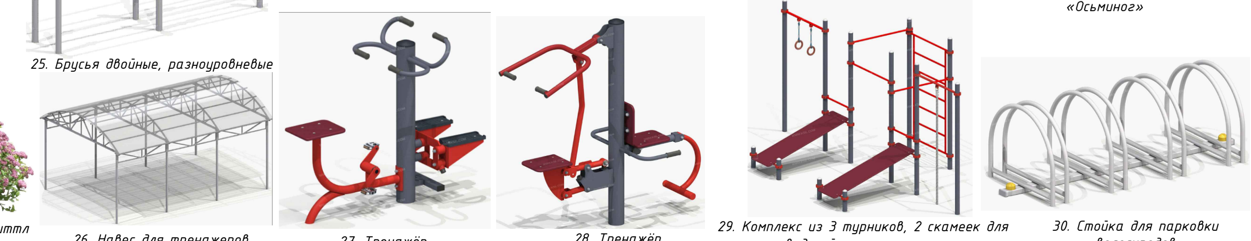
25. Брусья двойные, разноуровневые 26. Навес для тренажеров 27. Тренажёр 28. Тренажёр 29. Комплекс из 3 турников, 2 скамеек для пресса, шведской стенки, каната и колец 30. Стойка для парковки велосипедов