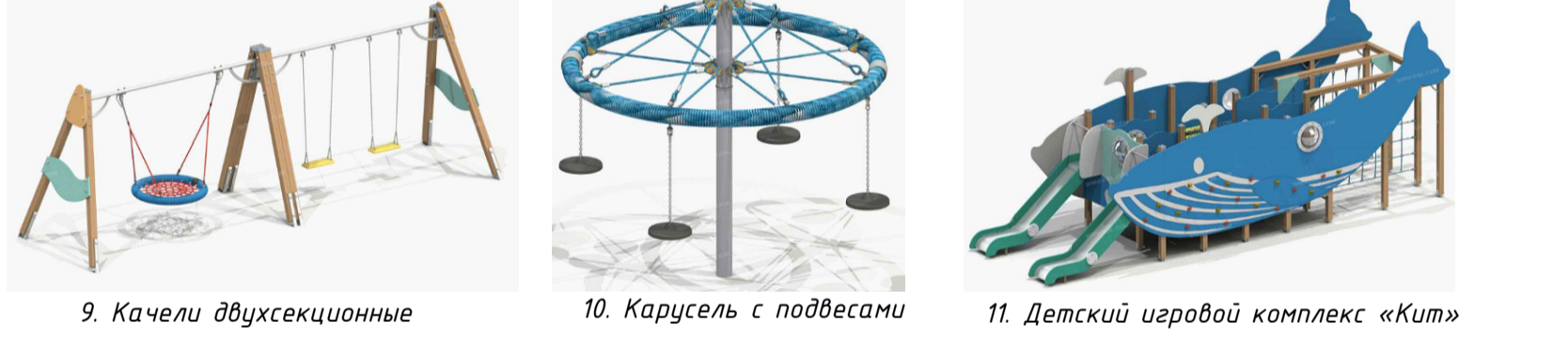
9. Качели двухсекционные 10. Карусель с подвесами 11. Детский игровой комплекс «Кит»