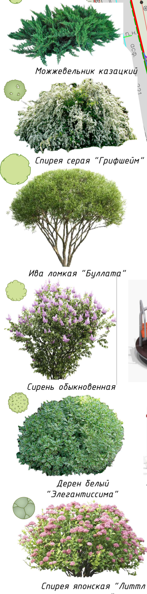
Можжевельник казацкий Спирея серая "Грифшейм" Ива ломкая "Буллата" Сирень обыкновенная Дерен белый "Элегантиссима" Спирея японская "Литл принцесс"