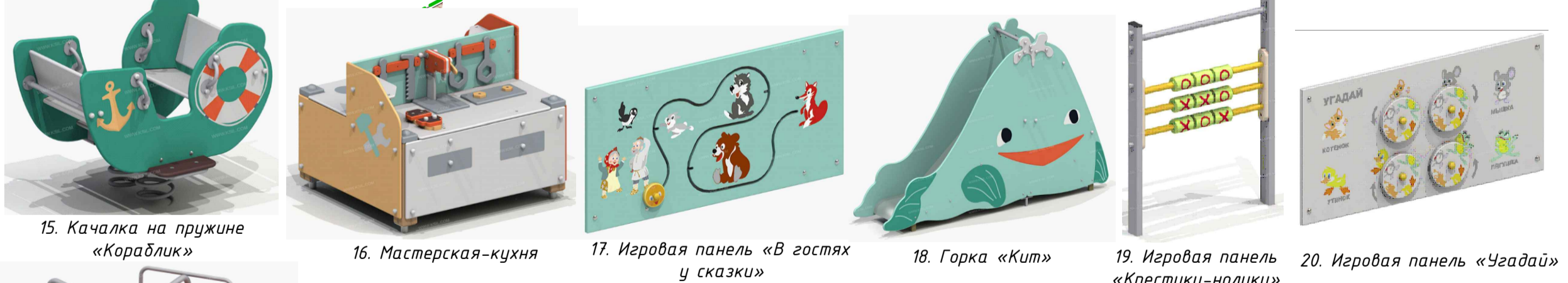
15. Качалка на пружине «Кораблик» 16. Мастерская-кухня 17. Игровая панель «В гостях у сказки» 18. Горка «Кит» 19. Игровая панель «Крестики-нолики» 20. Игровая панель «Угадай»