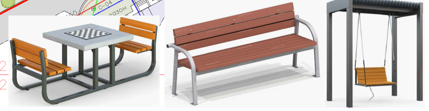
1. Шахматный стол "Турнир 2" 2. Диван садово-парковый 3. Качели "Пегас"