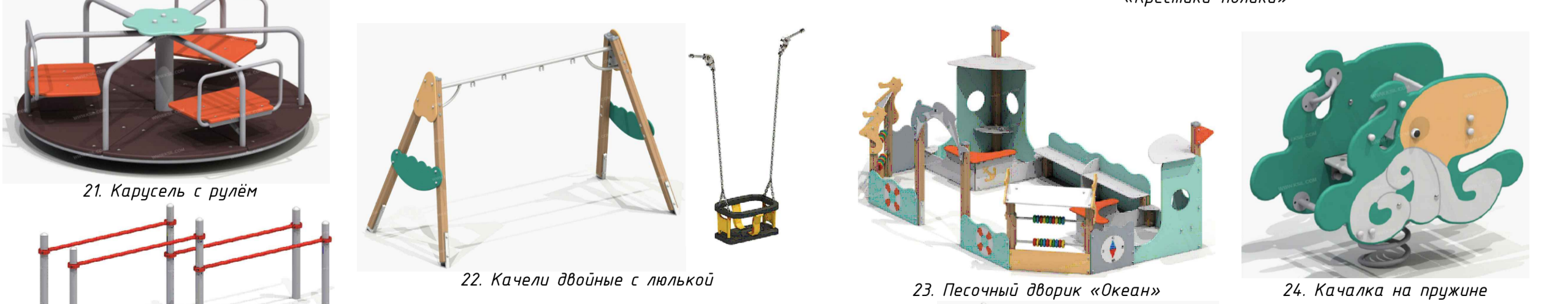
21. Карусель с рулём 22. Качели двойные с люлькой 23. Песочный дворик «Океан» 24. Качалка на пружине «Осьминог»