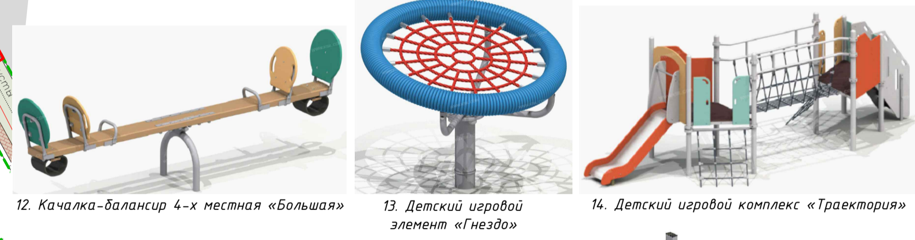
12. Качалка-балансир 4-х местная «Большая» 13. Детский игровой элемент «Гнездо» 14. Детский игровой комплекс «Траектория»