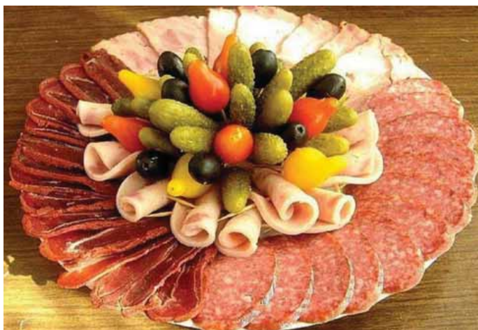
варианты оформления нарезки

Фету, творог и зелень положить в чашу блендера. Перемолоть до однородности. Орехи мелко нарубить ножом. Из сырной массы мокрыми руками сформировать шарики и обвалить их в нарубленных орехах. Поставить в холодильник и охлаждать в течение 30 минут.