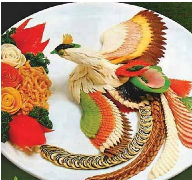
вариант украшения стола

Предлагаем приготовить эти закуски, которые украсят новогодний стол